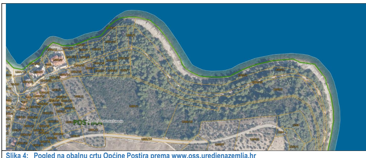
Slika 4: Pogled na obalnu crtu Općine Postira prema www.oss.uredjenazemlja.hr

Prema Zakonu o prostornom uređnju, ZAŠTIĆENO OBALNO PODRUĀJE predstavlja podruĉje jedinica lokalne samouprave koje ima izlaz na more, a PROSTOR OGRANIĀENJA predstavlja pojas širine 1300 metara (300 metara mjereno od obalne crte prema moru te 1000 metara mjereno prema kopnu). Obalnom crtom smatra se crta koja razdvaja kopno od mora određena propisima koji uređuju drŹavnu izmjeru i katastar (slika 4). Prema ĉlanku 25. Zakona