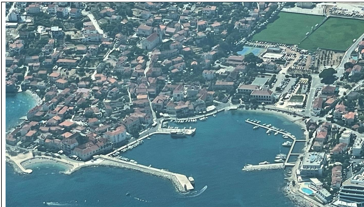
Slika 9: Luka otvorena za javni promet, Postira

Sukladno Zakonu o pomorskom prometu i morskim lukama , županijska skupština utvrđuje lučko područje za sve luke otvorene za javni promet županijskog i lokalnog značaja, u skladu s prostornim planovima i uz suglasnost Vlade RH. U proteklom razdoblju, lučka uprava Splitsko-dalmatinske županije izradila je prikaz obuhvata lučkih područja SDŽ na katastarskoj podlozi preklapljennoj preko DOF-a i time su utvrđeni obuhvati lučkih područja s pripadajućim namjenama.