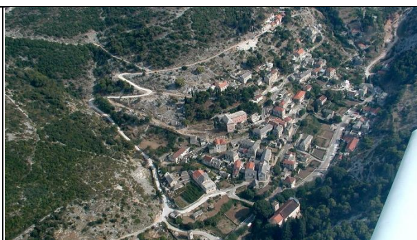
Slika 6: naselje Dol

Cijelo područje Općine pokriveno je s dvije katastarske općine (Postira i Dol). Unutar katastarske općine Postira nalaze se naselja Postira (s IGPIN Postira-Ratac i Lovrečina), a unutar katastarske općine Dol nalazi se naselje Dol (s IGPIN Podgažul i IGPIN „Strmica sjever“ i „Strmica jug“).