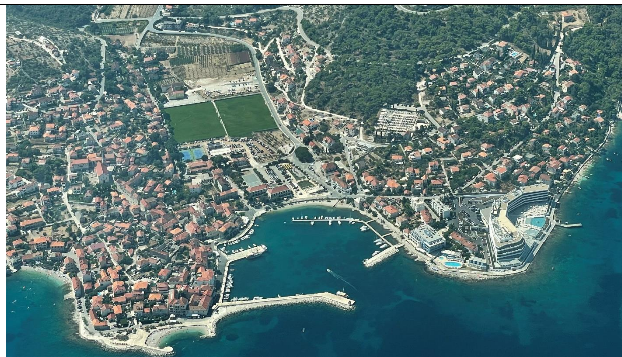
Slika 1: Pogled na naselje Postira iz zraka

Stanje i smjerovi kretanja prostornog razvoja Općine mogu se promatrati kroz pokrivenost područja Općine prostornim planovima različitih razina te dosljednost u njihovoj primjeni i možebitnim izmjenama i dopunama.