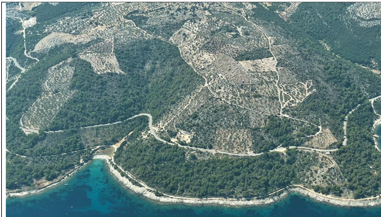
Slika 7: Pogled na ŽC6161

Prometnom studijom utvrđene su nerazvrstane ceste po pojedinim naseljima Općine, njihova ukupna dužina kao odnos dužine uređenih (utvrđena katastarska čestica) i neuređenih (neutvrđena katastarska čestica) dijelova nerazvrstanih cesta.