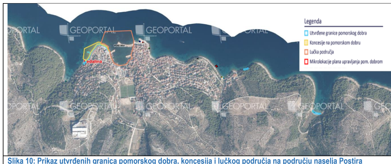
Slika 10: Prikaz utvrđenih granica pomorskog dobra, koncesija i lučkog područja na području naselja Postira

Na slici 10 vidljiv je prikaz granica pomorskog dobra, koncesija i lučkog područja naselja Postira.