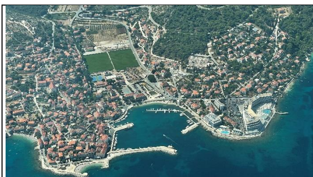
Slika 5: naselje Postira

Područje Općine Postira pokriveno je s dva (2) statistička naselja (slike 5, 6): Postira kao središnje općinsko naselje i Dol. Naselje Postira može se smatrati obalnim naseljem, dok je naselje Dol u unutrašnjosti. Broj stanovnika po pojedinim naseljima (Postira i Dol) prema popisima stanovništva do zaključno 2011. g. vidljiv je u tablici u poglavlju 1.3. U vrijeme pisanja ovog Izješća o stanju u prostoru objavljeni su podaci Popisa stanovništva s kraja 2021. g.