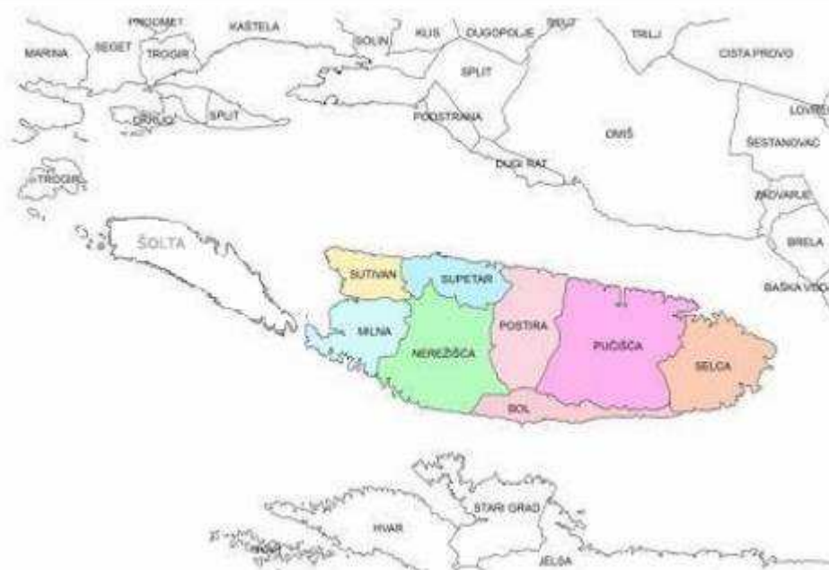
Slika 1. Jedinice lokalne samouprave na otoku Braču